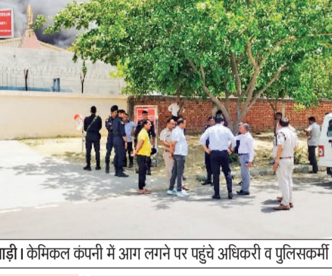
रेवाड़ी। केमिकल कंपनी में आग लगने पर पहुंचे अधिकारी व पुलिसकर्मी।