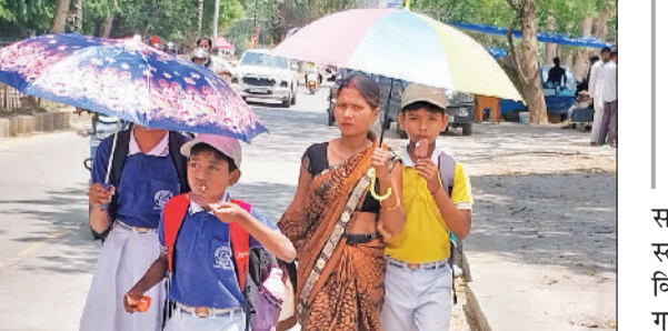
रेवाड़ी। मंगलवार को भीषण गर्मी में बच्चों का छाते से बचाव करती महिला। रात का तापमान भी पहली बार 5.0 डिग्री सेल्सियस बढ़कर 30.5 डिग्री सेल्सियस दर्ज किया गया। बीते सोमवार की रात इस सीजन की

पार हो गया है, जिससे लोगों को लू के प्रकोप का सामना करना पड़ रहा है। रात का पारा भी इस सीजन में पहली बार 30 डिग्री के पार पहुंच गया, जो सामान्य से 6 डिग्री सेल्सियस ज्यादा है। आसमान में बादल छाने का दौर बीते सप्ताह ही खत्म हो चुका है। सुबह से ही सूरज की तीव्र हवाओं को गर्म बनाना शुरू का देती है। सुबह 10 बजे के बाद ही गर्म हवाएं लू का रूप धारण कर लेती हैं। मंगलवार को अधिकतम तापमान 1.0 डिग्री सेल्सियस बढ़कर 45.5 डिग्री सेल्सियस पर पहुंच गया। यह इस सीजन का सर्वाधिक तापमान है।