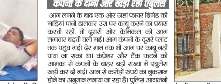
रेवाड़ी। बावल स्थित कंपनी में लगी आग व मौके पर मौजूद एसडीएम व पुलिस टीम।