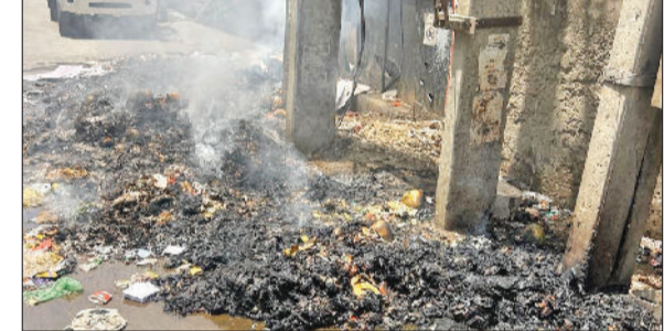
रेवाड़ी। ब्रास मार्केट में जलाया गया कचरा, धारूहेड़ा के सर्कुलर रोड पर जलाया गया कचरा।