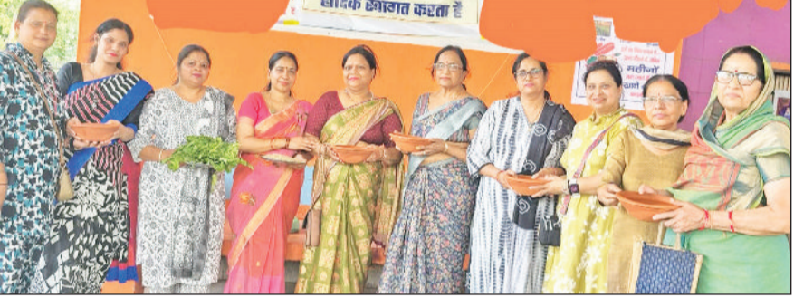
रेवाड़ी। सोलहराही मंदिर में पक्षियों के लिए दाना-पानी का प्रबंध करती महिलाएं।