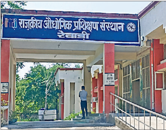
रेवाड़ी। पटौदी रोड स्थित राजकीय बाल आईटीआई।

स्कूल डवलपमेंट एवं इंटरस्ट्रयल ट्रेनिंग डिपार्टमेंट हरियाणा की ओर से प्रदेश की सभी सरकारी और प्राइवेट औद्योगिक प्रशिक्षण संस्थानों को एडमिशन प्रक्रिया के लिए निर्देश जारी किए गए हैं, जिसके बाद जिले की सभी सरकारी व प्राइवेट आईटीआई में तैयारी शुरू कर दी गई है। हालांकि अभी दाखिले के लिए शेड्यूल जारी नहीं किया गया है। जून के पहले सप्ताह से आईटीआई में विभिन्न ट्रेडों में दाखिले के लिए ऑनलाइन रजिस्ट्रेशन शुरू होंगे। एचबीएसई व सीबीएसई रिजल्ट जारी होने के बाद दसवीं व बारहवीं पास कर चुके विद्यार्थी विभिन्न ट्रेडों में दाखिला ले सकेंगे। गत वर्ष 2025 में औद्योगिक प्रशिक्षण संस्थानों में 6 जून से