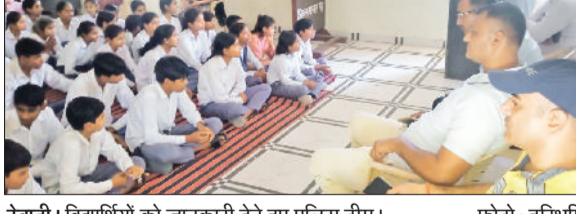
रेवाड़ी। विद्यार्थियों को जानकारी देते हुए पुलिस टीम।