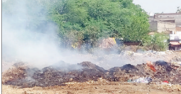
रेवाड़ी। ब्रास मार्केट में जलाया गया कचरा, धारूहेड़ा के सर्कुलर रोड पर जलाया गया कचरा।