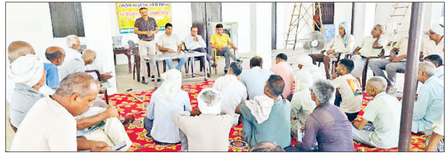
रेवाड़ी। किसानों को जानकारी देते हुए कृषि अधिकारी।

जिले की सभी राजकीय एवं प्राइवेट आईटीआई में जून के पहले सप्ताह से एडमिशन के लिए आवेदन प्रक्रिया शुरू होगी। विभिन्न दाखिले वर्गों में मेरिट सूची अलॉटमेंट जारी करने के कार्यक्रम की सूचना वेबसाइट पर ही उपलब्ध होगी। दाखिले के लिए 8वीं, 10वीं 12वीं के प्रमाण पत्र, परिवार पहचान पत्र, मोबाइल फोन ओटीपी के लिए, ई-मेल आईडी, जाति प्रमाणपत्र, पारिवारिक आय प्रमाणपत्र, हरियाणा रिहायशी प्रमाणपत्र, गैप इयर सर्टिफिकेट, बैंक अकाउंट पास बुक, पासपोर्ट साइज फोटो व आधार कार्ड देना अनिवार्य है।